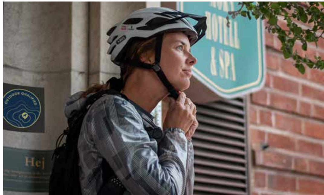
Emaljskylden monterad väl synlig vid entrén.