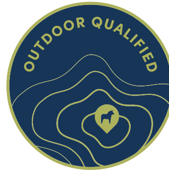
Märke som fil.